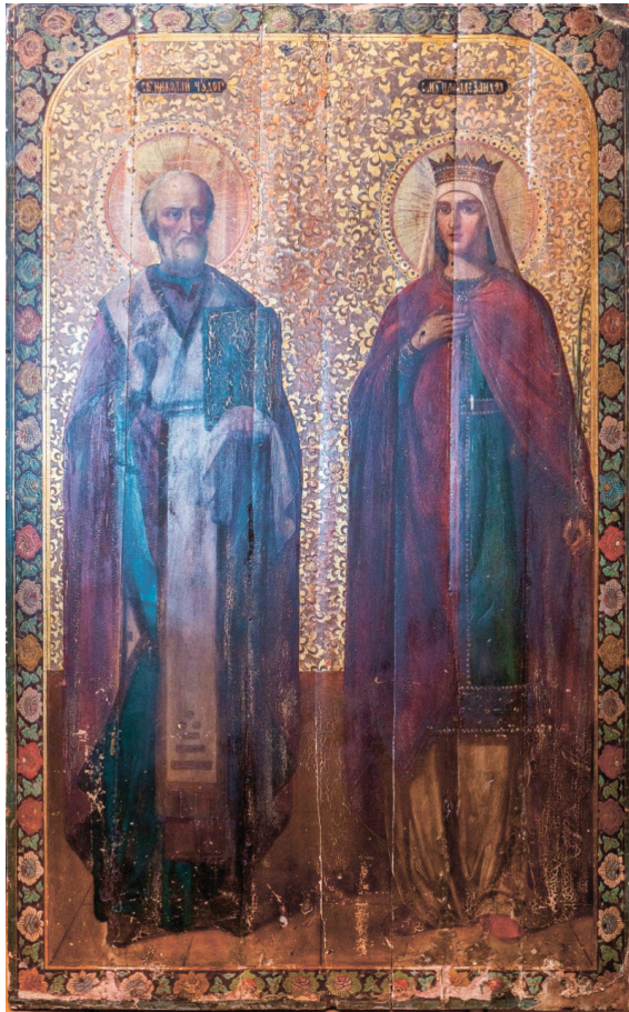
Рис. 3. Икона «Святитель Николай и мученица Александра». Без даты. Частное собрание.

Расположение святых относительно друг друга нетрадиционно: святитель Николай изображен с левой стороны. В композиционном решении передается диалог между святыми. Их лики слегка повернуты друг к другу, что придает жанровость сюжету. Святитель Николай облачен в синюю ризу и бордовую фелю, на плечах – белый омофор с золотыми крестами. В руках чудотворец держит большое Евангелие, украшенное золотой разделкой. Мученица написана в светлой тунике, сине-зеленой stole, подпоясанной узорным поясом и темно-пурпурном плаще, который застегнут на фибулу по центру. Такой вид одежды указывает на высокий статус женщины в период поздней Античности [21, с. 337]. Вариант изо-