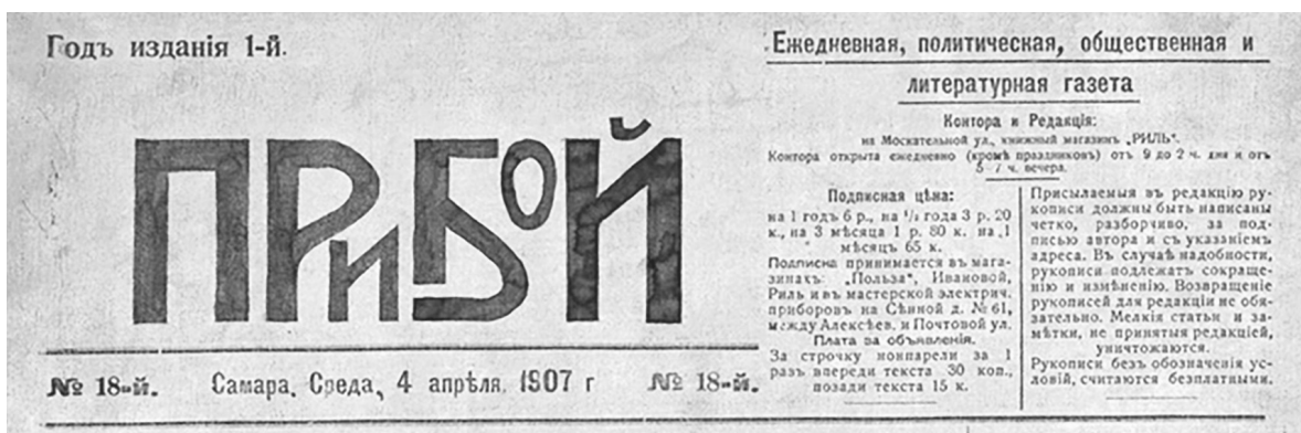
Ил.1. Самарская газета «Прибой» (1907)

ниями, за исключением издающей организации, нет. Юридически предшественниками «Волжской коммуны» стали газеты «Приволжская правда» Самарского комитета РКП(б) и «Солдат, рабочий и крестьянин» («Солдатская газета») Совета рабочих, солдатских, гарнизонного Совета крестьянских депутатов и фабрично-заводских комитетов.