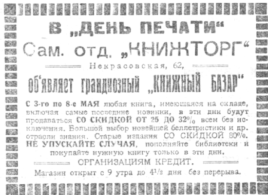
Ил. 8. Реклама Самарского книжторга

Волжско-Уральское отделение Центроиздата, которое специализировалось на литературе для национальных меньшинств, предлагало со склада издания на киргизском, чувашском, татарском, мордовском, еврейском и польском языках: «Хаджи-Мурат» Л.Н. Толстого, «Скупой рыцарь» и «Каменный гость» А.С. Пушкина, «Сказки» М. Горького, «Рассказ садовника» А.П. Чехова, «Четыре дня» В.М. Гаршина и др. 1 Анонимный автор в заметке «Спрос» и «предложение» от 15 мая сетовал, что в книжном магазине Губиздата из-за спроса на произведения Н.В. Гоголя, Ф.М. Достоевского, М.Ю. Лермонтова, И.А. Гончарова, А.С. Пушкина, И.С. Тургенева, М. Горького и пьесы А.П. Чехова все экземпляры разошлись «без остатка», а переизданий нет. Особенно успешно прошли продажи гончаровского «Обрыва», выпущенного издательством «Пролетарий» в новом правописании 2 . Аналогичная ситуация сложилась с книжной торговлей через киоски (при железнодорожном вокзале, на ул. Советской и др.). Все запасы популярной литературы (В. Вересаев, М. Горький) были к 15 мая распроданы. Оставались лишь разрозненные экземпляры книг М.Е. Салтыкова-Щедрина, Л.Н. Толстого и Н.С. Лескова 3 . Позднее