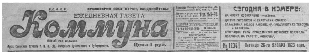
Ил. 2. Ежедневная газета «Коммуна» (1923)

Первая выходила с 17 марта, а вторая – с 23 ноября 1917 года. После возвращения советской власти в Самару редакции этих периодических изданий некоторое время находились в одном помещении, пока наконец Самарский губком РКП(б) не принял решение об их слиянии (10.11.1918). 7 декабря 1918 г. газета вышла под новым названием: «Коммуна» (ил. 2). В качестве учредителей были обозначены губком РКП(б), губернский и городской исполнительный комитет советов. 19 августа 1928 г., после создания Средне-Волжской области, газета была переименована в «Средне-Волжскую коммуну». 6 декабря 1929 г., в связи с преобразованием Средне-Волжской области в край, она получила новое название – «Волжская коммуна», которое носит по сей день [См.: 1–3].