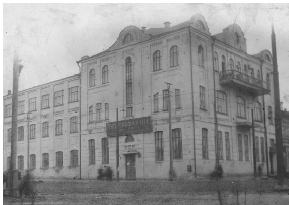
Ил. 5. Типография № 1. Бывшее здание Самарской губернской типографии.

Учреждения Самарского полиграфпрома перевели на хозрасчет и вплоть до урожая 1923 г. обеспечивали пайками через Москву по плану продовольственного снабжения. Произошло укрупнение предприятий. Типографии № 1 и № 2 (ил. 5) сосредоточили ресурсы типографии № 5, литографии, ремонтной мастерской, а также административный аппарат. Чистая прибыль полиграфпрома за 5 лет составила 248 534 рубля. Причем первым экономически успешным оказался 1924/25 отчетный год. В качестве серьезного достижения рассматривался запуск фабрики (литографии) «Свободный Труд», которая бездействовала с 1917 года. Численность рабочих-печатников выросла с 252 человек (на 1 марта 1922 г.) до 344 человек (к марту 1927 г.). Реализация продукции осуществлялась через магазин «Полиграф», причем были налажены торговые связи не только внутри Самарской губернии, но и за ее пределами, с 76 населёнными пунктами СССР 1 .