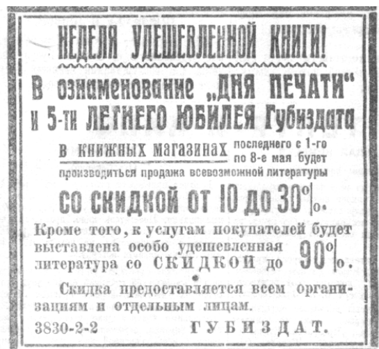
Ил. 7. Реклама книжных магазинов Самарского губиздата

Ежегодно 5 мая в стране и в Самаре отмечался День печати. В 1927 г. «Коммуна» откликнулась на этот праздник книготорговой рекламой. По случаю этого праздника и пятилетия Губиздата на срок с 1 по 8 мая в книжных магазинах Самарского губиздата объявили всем организациям и частным лицам скидку на литературу от 10 до 30 %, а по некоторым категориям изданий – до 90 % 4 (ил. 7).