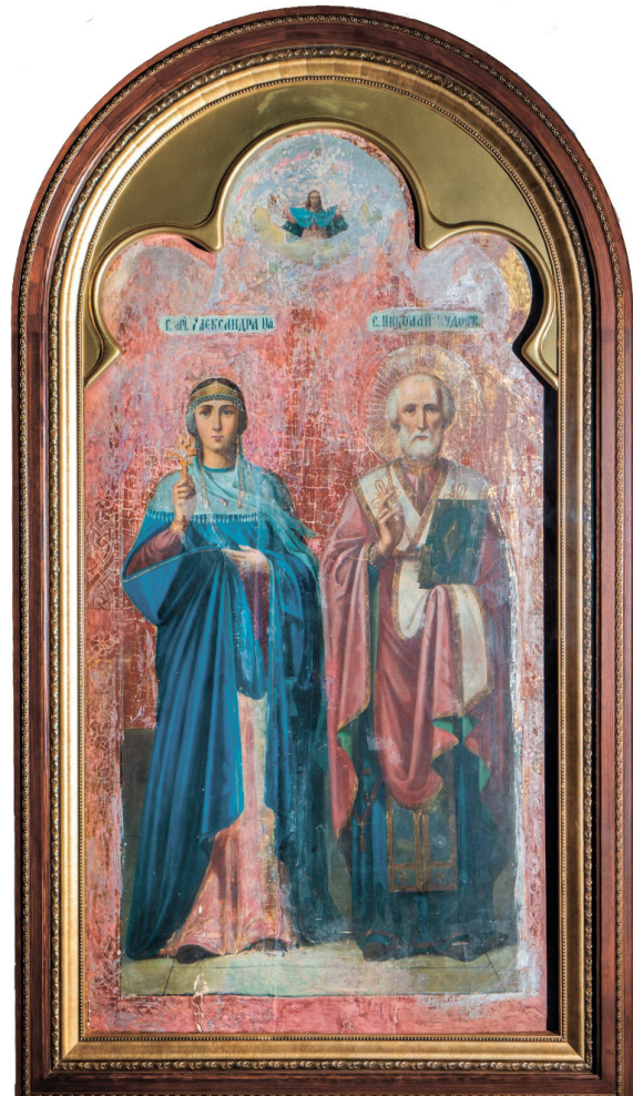
Рис. 2. Икона «Святитель Николай и мученица Александра». Без даты. Барнаул. Храм апостола Иоанна Богослова.

Он представлен в традиционных одеждах, но концы гиматия зафиксированы у горловины наподобие княжеского плаща или царской мантии. Сын Божий изображен с архиерейским жестом благословения двумя слегка поднятыми руками 1 . Это может косвенно указывать, что данный образ был создан к торжествам венчания или коронования Николая II и Александры Федоровны.