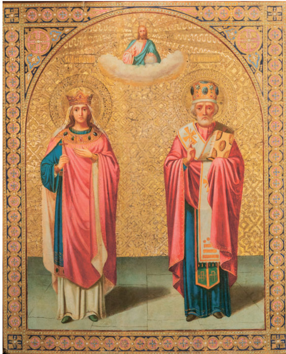
Рис. 1. Икона «Святитель Николай и мученица Александра». Без даты. Частное собрание.

Руси в допетровскую эпоху [17, с. 51]. Венец на голове царицы по форме тяготеет к западноевропейским средневековым образцам. Царский убор изображен в виде короны с чередующимися по высоте острыми завершениями. Он декорирован драгоценными камнями и жемчугом в соответствии с иконописной традицией. Аналогичные формы встречаются в произведениях поздней русской иконописи [18, с. 88].