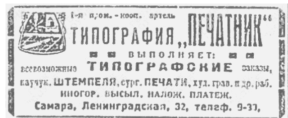
Ил. 9. Реклама типографии «Печатник»

Накануне образования Средне-Волжской области, в марте-мае 1928 г., в «Коммуне» печаталось много рекламных сообщений и объявлений, имеющих историко-книговедческую ценность. Так, из рекламы в № 61 от 11 марта можно узнать, что типография «Печатник» принимала заказы по адресу: ул. Ленинградская, д. 32 (ил. 9).