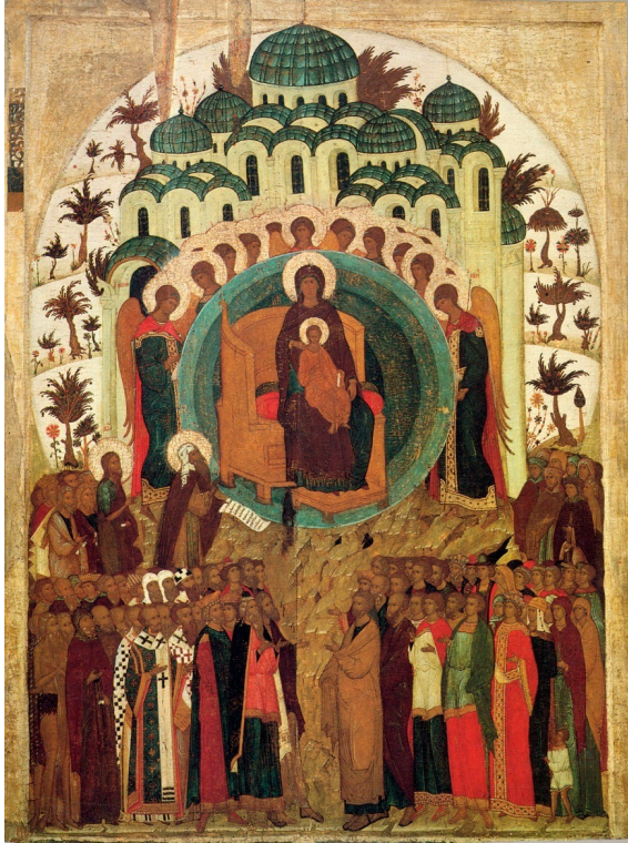
Рис. 4. Икона «О Тебе Радуется». XVI в. Дерево, темпера. 146x110. Москва. Государственная Третьяковская галерея

Актуальность изучения иконописных образов, связанных с историческими событиями нашего Отечества, подтверждается публикациями ведущих исследователей. Стремление к особому почитанию и сакрализация царской власти в Российской империи проявили себя в организации юбилейных торжеств и появлении в их контексте икон-памятников. Выявленные произведения иконописи и их иконографические принципы свидетельствуют о формировании традиции изготовления именных икон династии Романовых, распространенной в России в конце XIX – начале