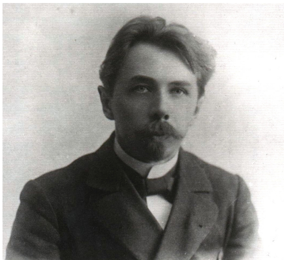
Ил. 6. А.А. Смирнов (Треплев) (1864–1943). Фотография из фондов Самарского литературно-мемориального музея им. М. Горького

Видимо, для контраста актуальной статистике редакция поместила в апрельском номере очерк самарского писателя А.А. Смирнова (Треплева) (ил. 6) «Начало печатного слова в Самаре».