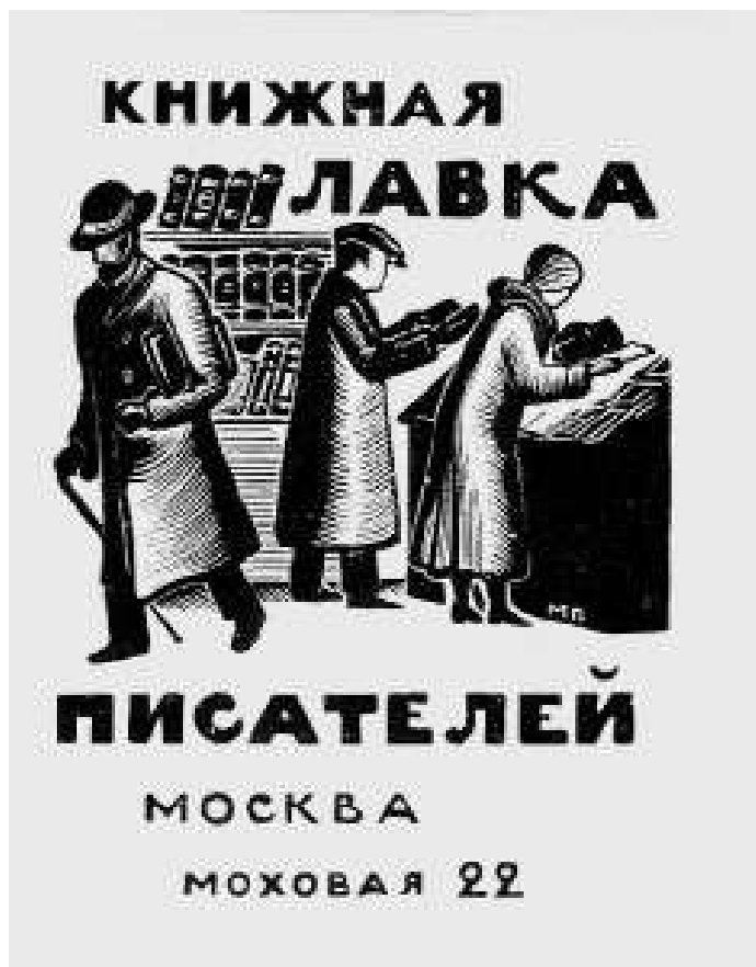
М.И. Пиков. Книжный знак Книжной лавки писателей. 1929. Гравюра на дереве. 5,9×4,5