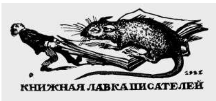
Книжные знаки Книжной лавки писателей. 1921. Гравюры на дереве: В.А. Фаворский. 4,4×7,4 В.Д. Фалилеев. 4,5×11