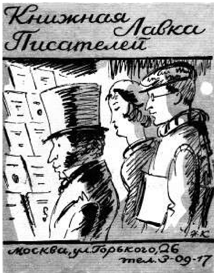
Книжная лавка писателей. 3 мая 1931 – 15 августа 1934. К Первому Всесоюзному съезду советских писателей. 1934. Обложка. Рис. Н.В. Кузьмина. 16,5×12,7