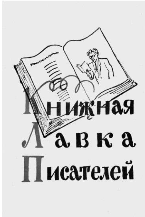
Книжная лавка писателей. 1932–1957. 1957. Обложка. 19,5×13