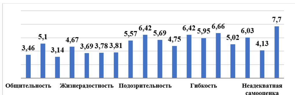
Рис. 2. Результаты изучения личностных свойств студентов в структуре ценностно-смысловой сферы по методике «16 факторный личностный опросник» Р. Кеттелла.

Далее в рис. 2 показаны данные исследования по личностному компоненту студентов.