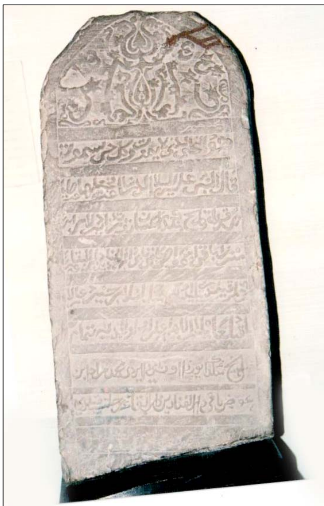
Рис. 9. Намогильная плита с Ханского кладбища. Сборы В.Н. Пигнатти 1912 г.

Кожа, металл, медь, позолота. ГАУК ТО «Тюменское музейно-просветительское объединение».