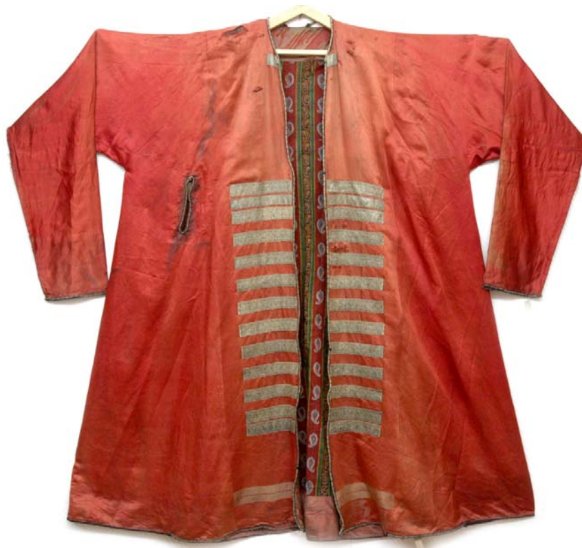
Рис. 3. Халат женский. Вторая половина XIX – начало XX в. ГАУК ТО «Тюменское музейно-просветительское объединение».