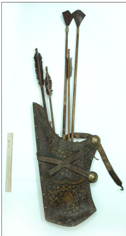
Рис. 8. Колчан для стрел восточного типа (саадак). XVII – середина XVIII в.

– Назар, Мурзат, Сабанак, Маметмурат и Хоцамшукур (Самигулов, Тычинских, 2018: 102).