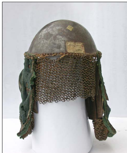
Рис. 7. Шлем – типа мисюрки. XVII в. Железо, медь, сукно, ковка, клепка. ГАУК ТО «Тюменское музейно-просветительское объединение».

В музей поступил шлем «полуяйцевидной формы чаша, выкованная из одного куска, на верху – 4-х угольное овальное отверстие. Тонкий прорезной орнамент из отдельных пластинок с пальметками» (КП ТМ 5422) и колчан татарский. В книге поступлений дается следующее описание колчана: «Восточного