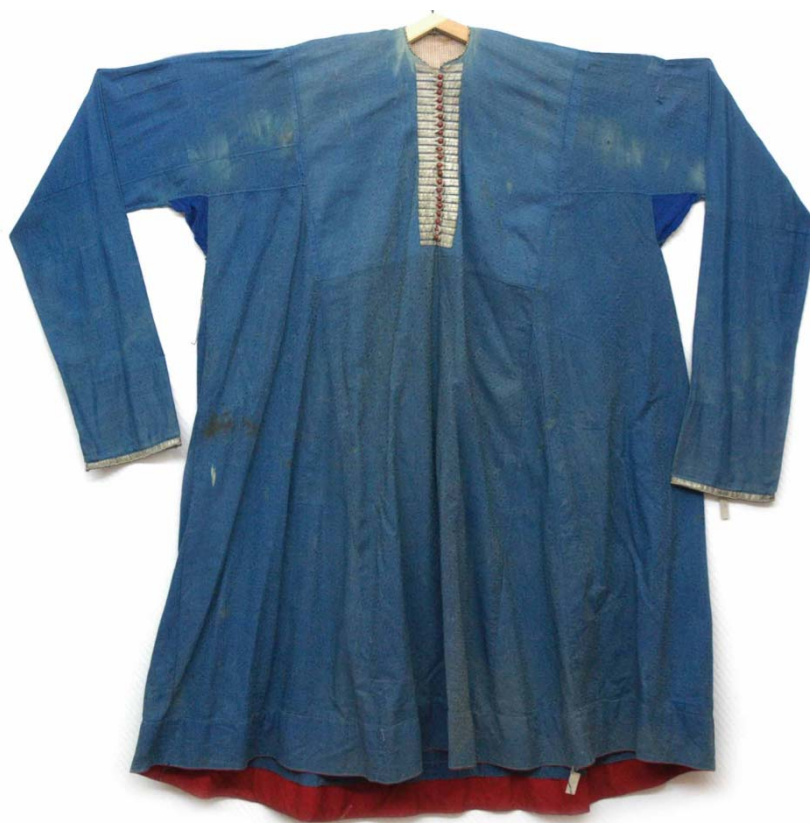
Рис. 2. Платье женское. Вторая половина XIX – начало XX в. ГАУК ТО «Тюменское музейно-просветительское объединение».