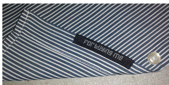
Рис. 1б. “for buying me”. Fig. 1b. “for buying me”.