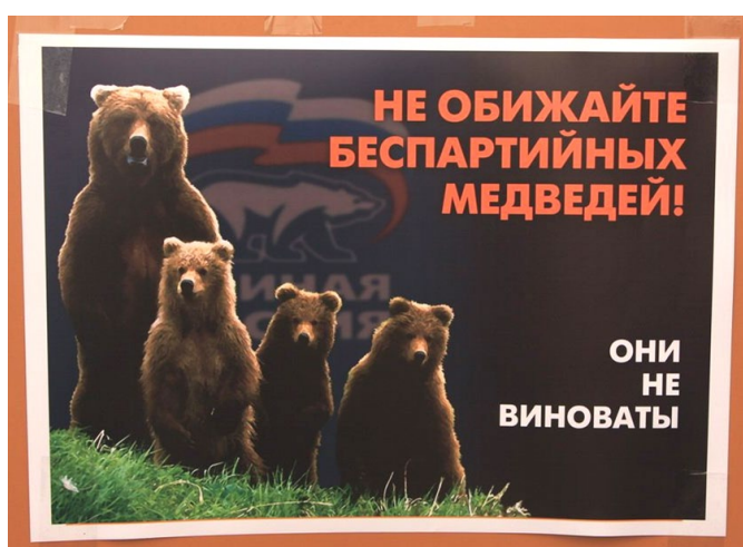
Рис. 9. Аллюзия Fig. 9. Allusion

Участники Британского проекта Brandalism (контаминация слов «Бренд» + «вандализм») за несколько дней до Международной конференции стран-участниц Конвенции ООН по проблемам изменения климата (COP21) разместили в Париже более 600 пла-