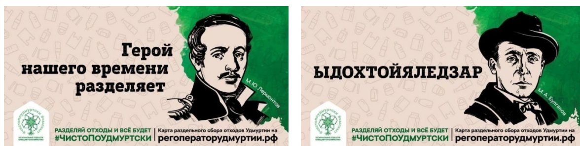
Рис. 4. Реминисценция явная и сложно определяемая Fig. 4. Reminiscence is clear and difficult to define

Этот пример достаточно наглядно иллюстрирует тезис о том, что при использовании реминисценций адресат вовлекается в игру по расшифровке послания. Если это ему удаётся, он получает интеллектуальное удовольствие и в результате формирует положительное отношение к предлагаемой идее. Однако, если не удаётся, возникает отторжение, что пагубно сказывается и на восприятии самой пропагандируемой идеи. В связи с этим выбор между увеличением креативности послания и увеличением его понятности для адресата должен всегда делаться в пользу второго.