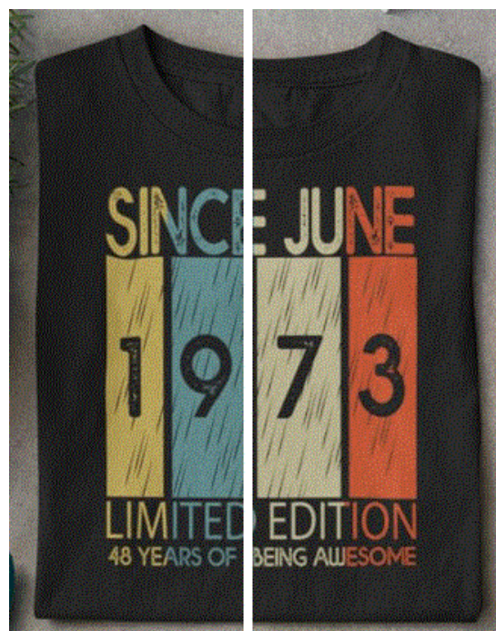
Рис. 2 / Fig. 2. Since June 1973.