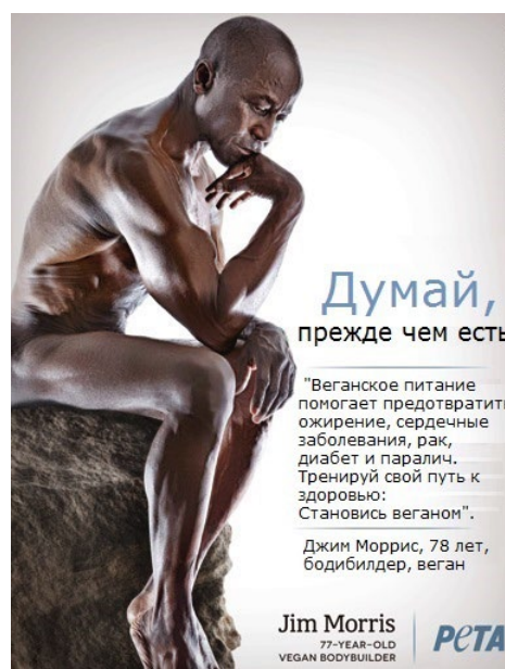
Рис. 6. Реминисценции на визуальные произведения искусства Fig. 6. References to visual works of art

Отдельно упомянем реминисценции на ранее созданные плакаты, популярные во всех рубриках СР. Чаще других в российской СР в качестве источника используются плакаты «Родина-мать зовёт» и «А ты записался добровольцем?» Как известно, прототипом последнего плаката, созданного Д. Моором в 1920 г., был британский постер «Лорд Китченер надеется на тебя», который использовался потом для создания аналогичных плакатов в Италии, Германии, США, Бразилии и России. В связи с этим на современных пла-