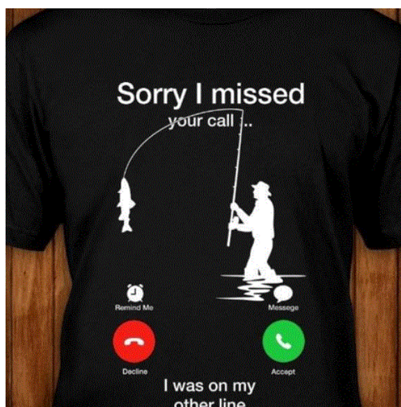
Рис. 3 / Fig. 3. Sorry, I missed your call.