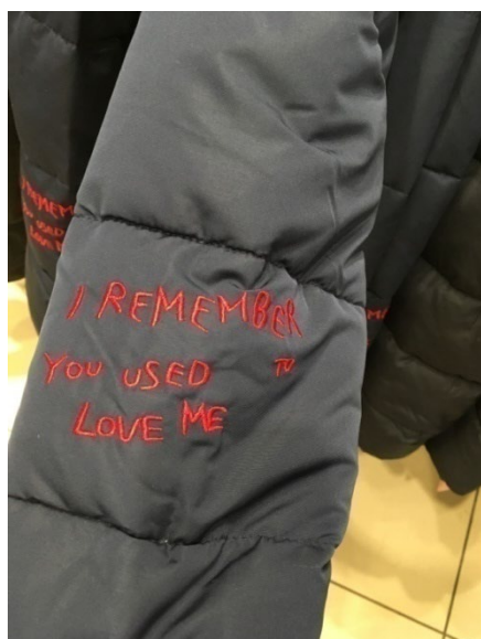
Рис. 4 / Fig. 4. I remember you used to love me.

2.2. Необычная коммуникативная ситуация – инструкция по стирке и уходу за пуховиком из гусиного пуха, написанная в виде комикса от имени гуся, то есть одежда «разговаривает» с потребителем посредством картинки-комикса: “Easy to wash! I wash in a mild soap. I rinse well... and dry in an aerated