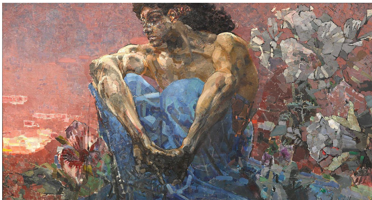
Рис. 2. Демон сидящий. 1890 г. Fig. 2. The Demon Seated. 1890

Следующим обращением к данному образу станет иллюстрация к «Демону» М.Ю. Лермонтова, передавшая столь чётко данный образ, что именно это воплощение и стало наилучшим. Этих двух великих людей – М. Врубеля и М. Лермонтова, объединял поиск идеала непокорённого человека. И их Демон – это не носитель зла, а символ мятежного начала, восставший против Творца, не желающий подчиняться. Как считал сам Врубель: «Демон» значит «душа» и олицетворяет собой вечную борьбу мятущегося человеческого духа, ищущего примирения обуревающих его страстей, познания жизни и не находящего ответа на свои сомнения ни на земле, ни на небе» [4, с. 279].