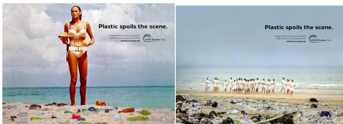
Рис. 8. Реминисценции в серии «День мирового океана» Fig. 8. Reminiscences in the series “World Ocean Day”