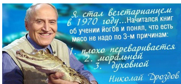
Рис. 1. Цитация Fig. 1. Citation