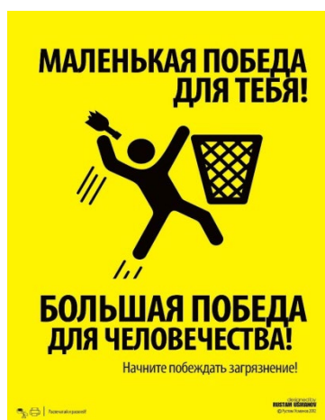
Рис. 3. Реминисценция как отсылка к высказыванию Луи Армстронга при высадке на Луну