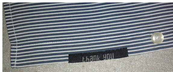
Рис. 1а. “Thank you”. Fig. 1a. “Thank you”.

потому что она действительно любит тебя (рис. 5).