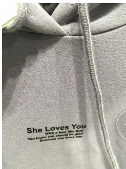
Рис. 5 / Fig. 5. She loves you.

2.5. Необычная коммуникативная ситуация: экологический текст на спортивной кофте и брюках от производителя, информирующий о стадиях производства: “These track pants are colored with an environmentally friendly dye, created using a recycled water system. The fabric is made from recycled and organic cotton mix”. Эти спортивные штаны покрашены краской, не наносящей вред окружающей среде, созданной с использованием системы переработки воды. Материал сделан из смеси переработанного и органического хлопка» (рис. 9).