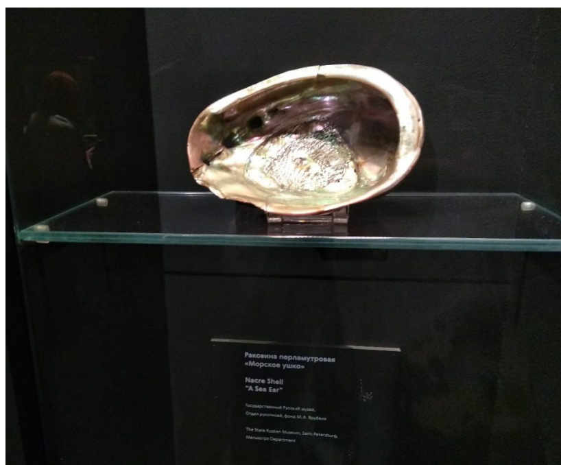
Рис. 4. Раковина-пепельница М. Врубеля «Морское ушко»