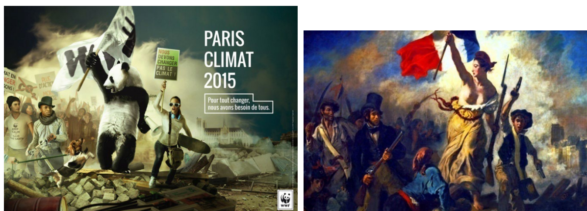
Рис. 10. Визуальная аллюзия Fig. 10. Visual allusion

катов, на которых объявили политиков и известные бренды «частью проблемы» глобального потепления. Активисты французского «брендализма» утверждали, что переговоры, где решаются жизненно важные вопросы, от которых зависит будущее планеты, проходят под патронатом и при финансовой поддержке главных загрязнителей. В связи с этим на плакатах изображались известные политики, главы государств, корпорации, которые, по мнению авторов, повинны в изменении климата. На рис. 11 воспроизведены два плаката этой серии, изображающие Синдзэ Або, премьер-министра Японии, и Дэвида Кэмерона, премьер-министра Великобритании. Оба плаката содержат аллюзии на факты из деятельности этих политиков, которые способствовали загрязнению атмосферы. В данном случае интертекстуальность понимается предельно широко: как пишет А.М. Амагов, «смысл текста заключается не только (а иногда и не столько) в нём самом, сколько в тех многочисленных связях, которые соединяют текст с окружающей действительностью (физической, биологической, социальной) и образуют дискурс» [18, с. 5].