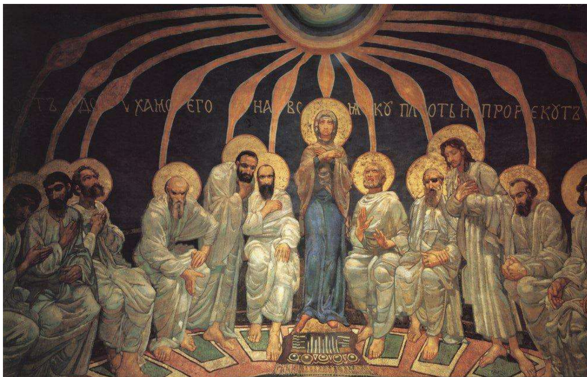
Рис. 1. «Сшествие Святого духа на апостолов». 1885 г. Коробковый свод Кирилловской церкви в Киеве

Итак, картина «Демон сидящий» представляет собой интересную интерпретацию данного персонажа (рис. 2). Демон, глядящий вдаль, не кажется страшным, представляющим чёрные силы. А лиловый цвет фона, который станет знаковым для Врубеля, смягчает образ. Манера написания картины напоминает мозаику – она непривычная и своеобразная, похожая как на эмаль, так и на витраж. Композиционно фигура самого демона в центре, но он среди цветов, светлых и раскрытых. Он задумчив, почти смиренен, красив. Его мускулы выписаны грубыми, почти скульптурными мазками. Грусть и невысказанность прослеживается во взгляде уже появившихся в творчестве Врубеля чёрных глаз.