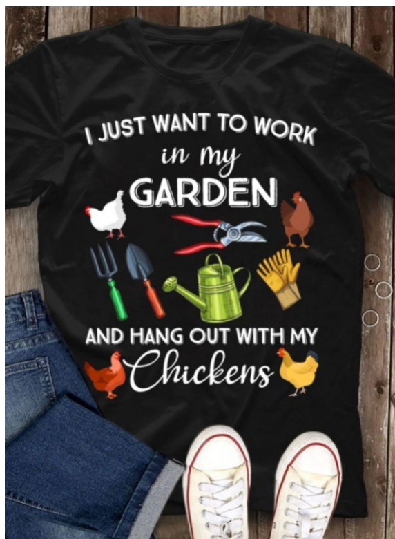
Рис. 7 / Fig. 7. I just want to work in my garden.