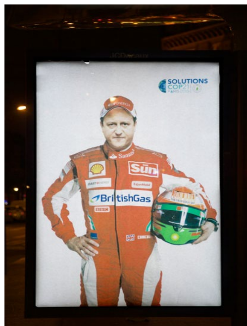
Рис. 11. Аллюзия на события Fig. 11. Allusion to events

Здесь роль визуального компонента, привлекающего внимание адресата, выполняет портрет автора цитаты. Если он интересен адресату, тот захочет ознакомиться и с содержанием послания. Причём если для товарной рекламы обычно рекомендуют использовать такие цитаты, которые наверняка известны массовому адресату, то для СР более важно, чтобы известным был автор цитаты, в то время как текст должен быть по возможности оригинальным и поучительным.