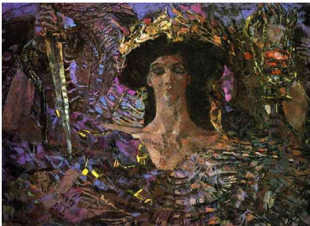
Рис. 6. «Шестикрылый Серафим», 1904 г. Государственный Русский музей, Санкт-Петербург Fig. 6. “Six-Winged Seraph”, 1904. State Russian Museum, St. Petersburg

Художникам всегда было трудно вывести образ Серафимов, ведь они ангелы, которые стоят вокруг Бога и прикрывают одной из пар крыльев лицо, чтобы не видеть лица Бога. «Вокруг Него стояли Серафимы; у каждого из них по шести крыл: двумя закрывал каждый лице своё, и двумя закрывал ноги свои, и двумя летал. И зывали они друг ко другу и говорили: Свят, Свят, Свят Господь Саваоф! вся земля полна славы Его!» 3 . Серафимы являются воинством Божиим, которое неустанно прославляет Бога и наказывает непослушных. Изображения Серафимов традиционно делают яркими красными красками, словно летающий огонь. В обязанность Серафимов входит оберегать Бога и разжигать любовь к нему в сердцах людей, они очищают душу Божественным огнём, вдохновляя на проповедь. Серафимы – ангелы высшего чина. Они плотно окружают Бога, полностью закрывая его своими телами, непрерывно воспевают и славят Всевышнего. Согласно иконографической традиции, Се-