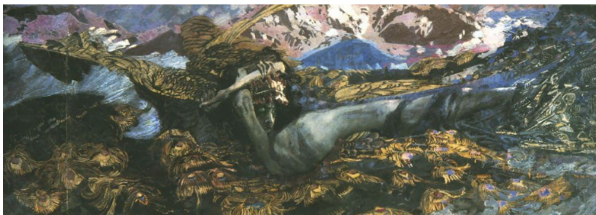
Рис. 3. Демон поверженный. 1902 г. Государственная Третьяковская галерея Fig. 3. The Demon Downcast. 1902. State Tretyakov Gallery