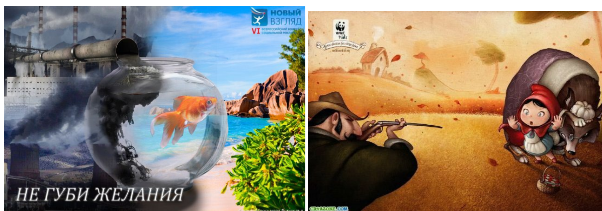
Рис. 5. Реминисценции на известные литературные (кино-) персонажи Fig. 5. Reminiscences of famous literary (film) characters