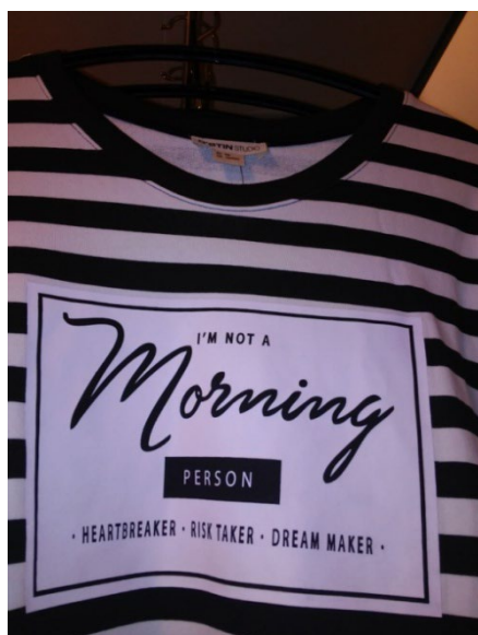
Рис. 8 / Fig. 8. I am not a morning person.