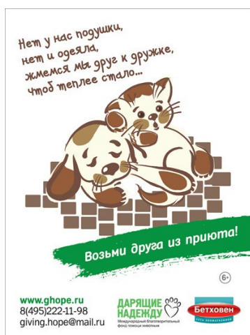
Рис. 2. Реминисценция на пьесу С. Маршака «Кошкин дом»