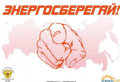
Рис. 7. Реминисценции плаката «А ты записался добровольцем?» Fig. 7. Reminiscences of the poster “Did you sign up as a volunteer?”