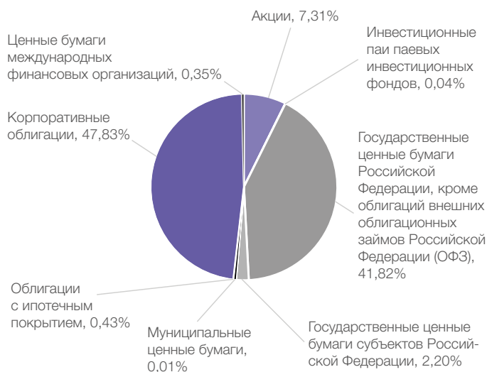
Рис. 1. Состав средств пенсионных накоплений НПФ по состоянию на 30.09.2024 (источник: Банк России [5])

Данные о размещении средств негосударственных пенсионных фондов позволяют оценить роль финансовых институтов этой категории в развитии рынка денег и рынка государственного долга. Структура рынка денег, отображенная в таблице 1, позволяет оценить структуру получателей средств пенсионных накоплений и поддерживает вывод о высокой концентрации капитала за счет перераспределительных эффектов в экономике. Активы негосударственных пенсионных фондов, по данным ЦБ, превышают 5 трлн руб. на рассматриваемую дату, большая их часть направлена на развитие национального денежного рынка и фондирование государственного долга.