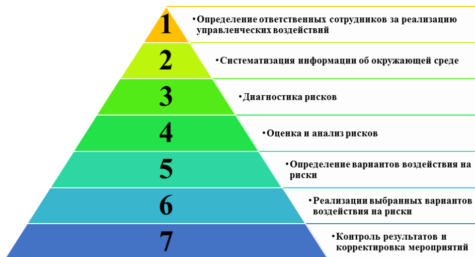
Рис. 2. Процесс реализации управленческих воздействий субъектами малого бизнеса по обеспечению экономической безопасности.

Fig. 2. The process of implementing management actions by small business entities to ensure economic security.