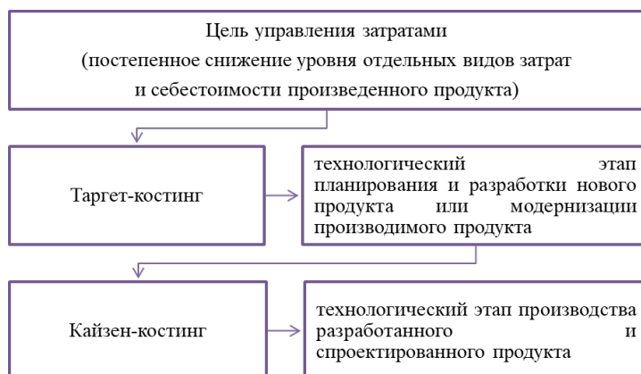
Рис. 1. Взаимодействие таргет-костинг и кайзен-костинг. Fig. 1. Interaction between target costing and kaizen costing.

Цель таргет-калькуляции (кайзен-калькуляции) заключается в постепенном достижении заданного уровня сокращения затрат, причем этот уровень постоянно корректируется в сторону дальнейшего сокращения затрат. Таргет-анализ (кайзен-анализ) отклонений позволяет сопоставить целевое со-