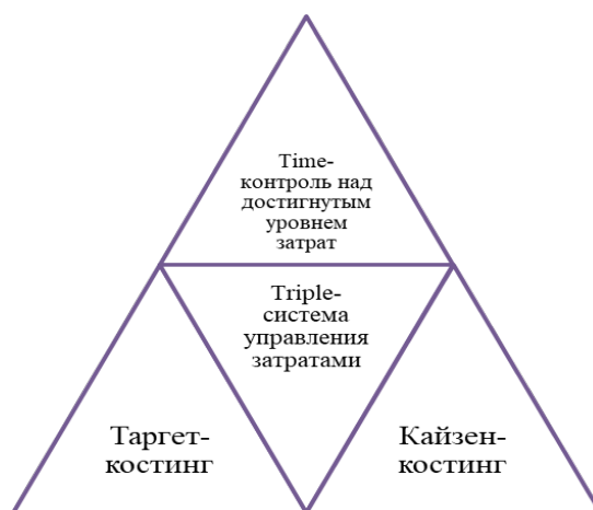
Рис. 3. Triple-система управления затратами.