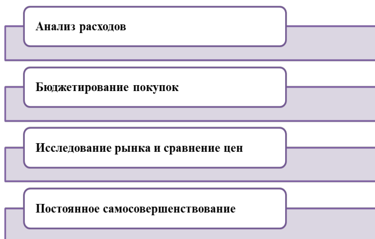
Рис. 3. Пути снижения расходов семьи. Fig. 3. Ways to reduce family expenses.

требуется кропотливая работа по систематическому контролю и сокращению расходов. Пути снижения расходов семьи показаны на рис. 3.