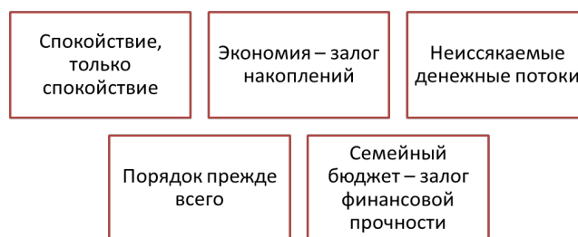
Рис. 1. Достоинства домашней экономики. Fig. 1. Advantages of home economics.

Первое достоинство «Спокойствие, только спокойствие». Каждого гражданина интересует вопрос: «Куда утекают семейные деньги?». Домашняя экономика предоставляет возможность фиксировать семейные расходы и дать ответ на этот вопрос. Регулярные подсчеты доходов и расходов, планирование предстоящих крупных расходов способствуют установлению контроля над семейными финансами, что позволит обрести спокойствие. В качестве успокаивающего фактора можно назвать возможность регулярно пересматривать доходы и расходы и видеть уязвимые периоды нехватки семейных финансов на осуществление платежей.