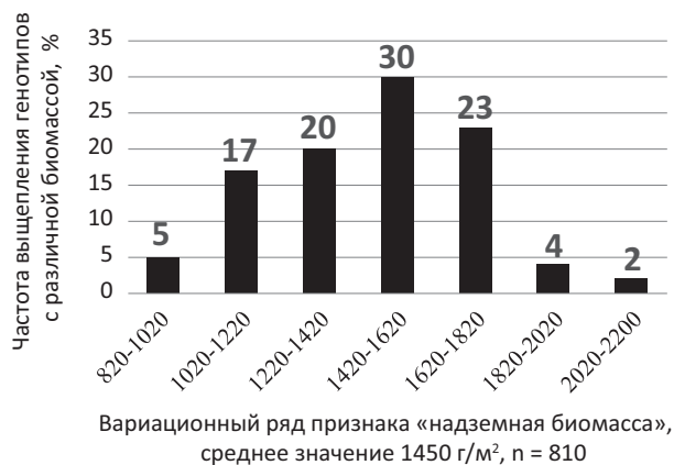
Рис. 3. Особенности выщепления генотипов из популяций по признаку «надземная масса», 2012–2021 годы.

Фотосинтез при сравнительно небольшой массе часто протекает более интенсивно и наоборот. Это подтверждает индекс ЭРЛ (эффективность работы листьев) – отношение урожая зерна на единице площади к индексу листовой поверхности на ней при колосении. [5] ЭРЛ при засухах варьировал в пределах 1,5...1,9, в год с повышенной влажностью – 1,1...1,25. Наиболее адекватной экспериментальным данным была линейная модель регрессии с формулой: