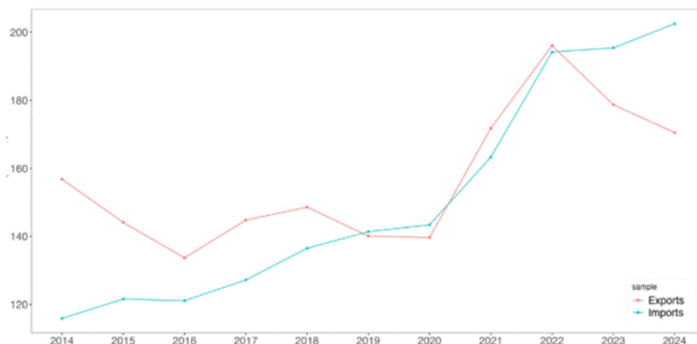
Рис. 2. Ежегодная динамика экспорта и импорта сельскохозяйственной продукции США в 2014–2024 гг., трлн долл. [ Agricultural Trade Series: US-China Trade Trends and Opportunities for Alfalfa Exports. URL: https://plainspress.scholasticahq.com/article/124556-2024-q1-agricultural-trade-series-us-china-trade-trends-and-opportunities-for-alfalfa-exports (дата обращения: 10.06.2025)]

США имеют дефицитный торговый баланс начиная с 1976 г., достигший рекордного значения в размере 131,4 млрд долл. в январе 2025 г. [ United States Balance of Trade. URL: https://tradingeconomics.com/united-states/balance-of-trade (дата обращения: 15.06.2025)].