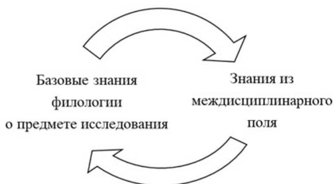
Рис 2. Синтетическая парадигма

Концентрационная схема взаимодействия представляет собой заимствование различных подходов и знаний о предмете исследований из междисциплинарного поля с целью корреляции информации и ее анализа.