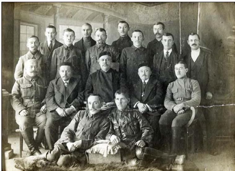
Мусульманский педтехникум. 1923 г.