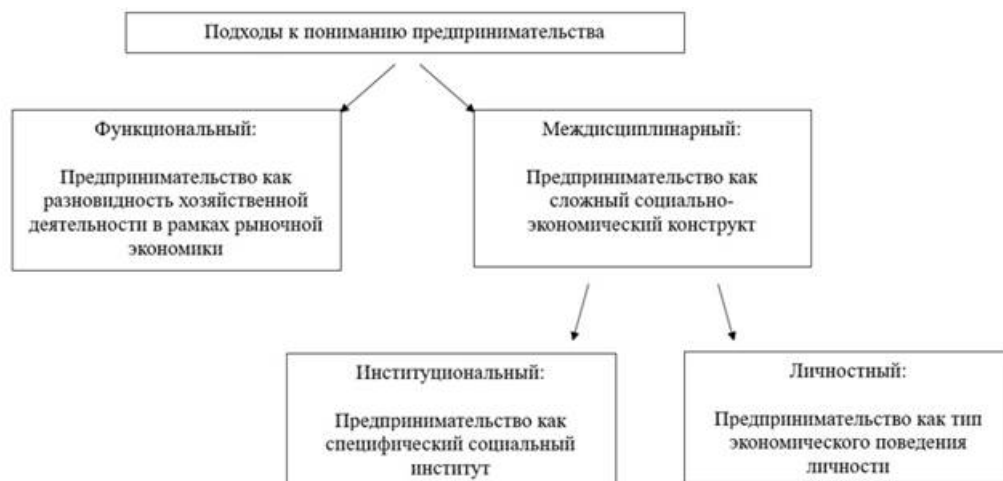
Рисунок 1. Альтернативная классификация подходов к интерпретации сущности предпринимательства