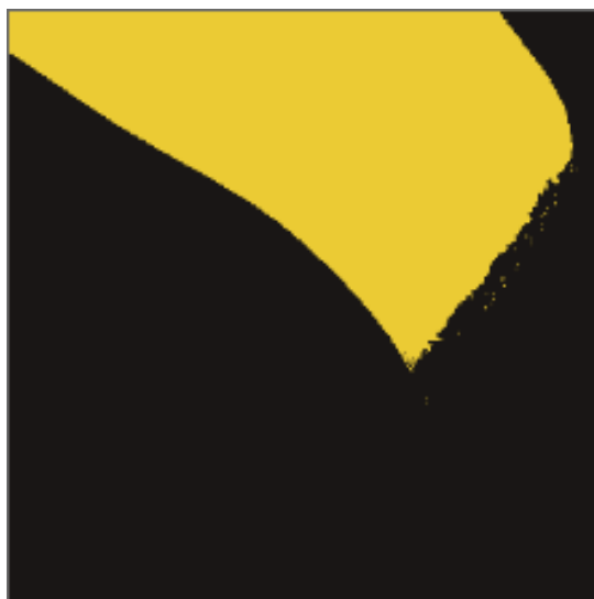
Рис.3. Результат выполнения алгоритма.

Результирующее изображение представлено на рисунке 3.