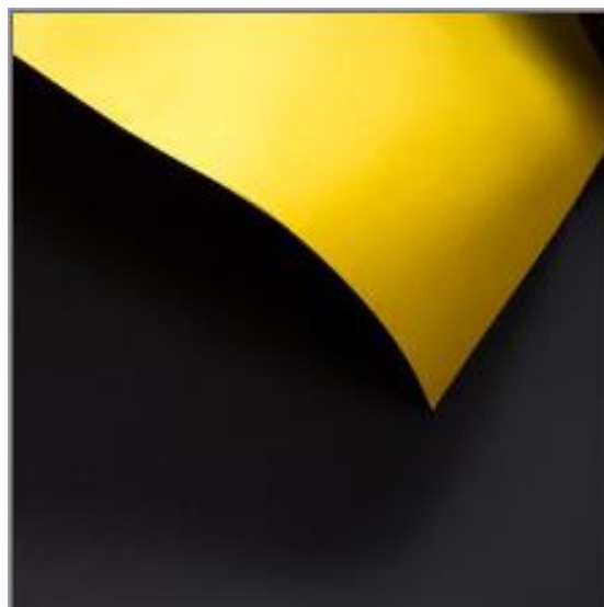
Рис. 2. Исходное изображение.

Для тестового примера было выбрано изображение, представленное на рисунке 2. Сегментация осуществлялась на 2 кластера.