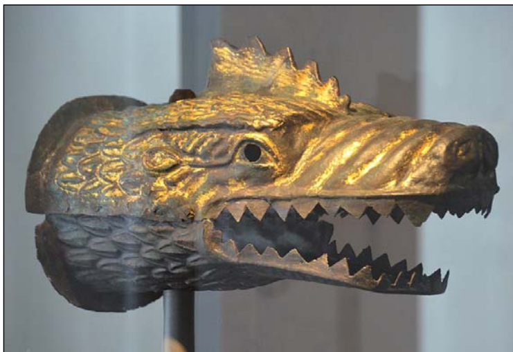
Рис. 6. Единственный сохранившийся драко, найденный в римской крепости Нидербибер. Государственный музей Кобленца (Landesmuseum Koblenz), Германия.

длинный шест, увенчанный бронзовой головой дракона с широко раскрытым ртом и привязанной к ней сзади цветной материей, когда ветер дул через открытый рот дракона она развевалась в виде змеи, и издавал звук напоминающий шипение (рис. 6–7). Известны они в Византии и у ранних Каролингов. Воин, несший дракона, назывался драконарий.