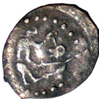
Рис. 3. Дракон на монетах Ивана Андреевича можайского (середина 30-х – конец 40-х гг. XV в. [12, с. 28, рис. 15].

Fig. 2. A mounted dragon-slayer on the coins of the appanage prince Ivan Andreevich of Mozhaik [12, p. 28, fig. 11].