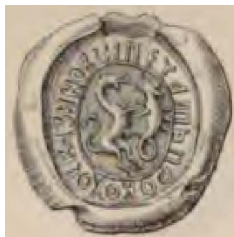
Рис. 9. Печать Прокофия (Скурата) Зиновьева (Станищева), прорисовка XIX в. [15, табл. III, № 1].

Fig. 8. The emblem of Emperor Andronikos II Palaiologos on the walls of Constantinople, 19th-century drawing [52, p. 189].