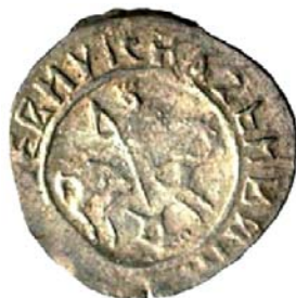
Рис. 2. Конный змееборец на монетах удельного князя Ивана Андреевича можайского [12, с. 28, рис. 11].

Fig. 1. A dragon-slayer shown on foot on the coins of Grand Prince Ivan Ivanovich the Young [13, p. 105].