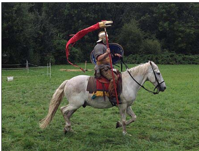
Рис. 7. Драконарий, современная реконструкция.

Fig. 6. The only extant draco found in the Roman fort of Niederbieber. Landesmuseum Koblenz, Germany.