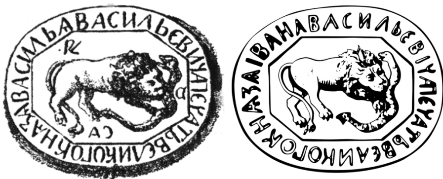
Рис. 4. Печати Василия II Васильевича и Ивана III Васильевича с сюжетом «Лев, пожирающий змею» [42, с. 208, 238].

Все три изображения явно объединены единым программным смыслом, однако для нас в первую очередь важны изображения льва и виверны (разновидность дракона). Заманчиво увидеть здесь аллюзию на сюжет перстневых печатей Василия II и Ивана III «Лев пожирающий змею» [40, с. 153–155] (рис. 4). Однако на перстнях помещена змея (гадина), и она явно выступает в роли жертвы, на барельефе дракон является одной из двух равнозначных ронованных фигур.