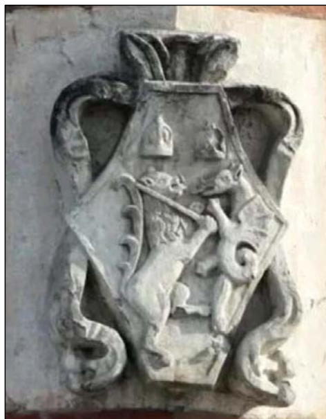
Рис. 10. Лев и дракон с Боровицкой башни Московского Кремля. Прорисовка [31, с. 151] и фотография.