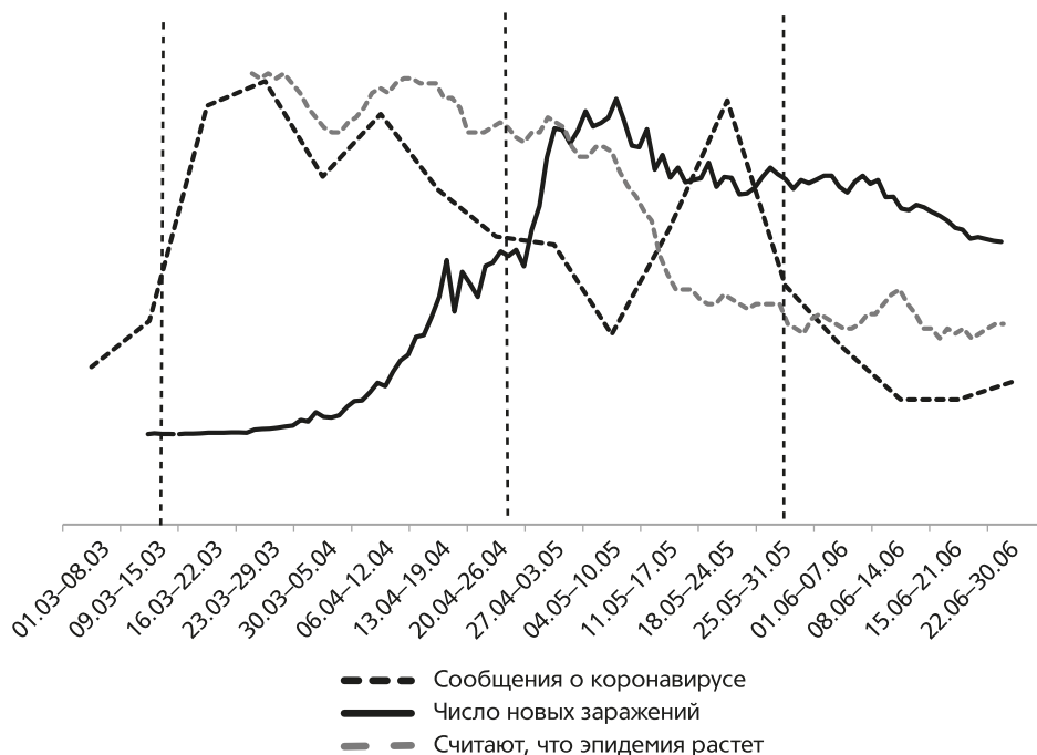
Рис. 2. Заболеваемость CODID-19 в России и плотность медиасюжетов на тему коронавируса на Первом канале телевидения в марте – июне 2020 г.

Примечание. «Сообщения о коронавирусе» – количество медиасюжетов о коронавирусе в программе «Время» на Первом канале по подсчетам ЦЕССИ, Yandex Dashboard на основе данных университета Д. Хопкинса ( https://datalens.yandex.ru/navigation/ca93mle5fxk6-purchases ). «Считают, что эпидемия спадает» – данные опросов коронаФОМ, Всероссийские телефонные опросы населения 18 лет и старше, 19 марта – 20 сентября 2020 года, вопрос «По вашему мнению, сейчас в России эпидемия коронавируса усиливается или идет на спад?» ( https://covid19.fom.ru/iskk ).