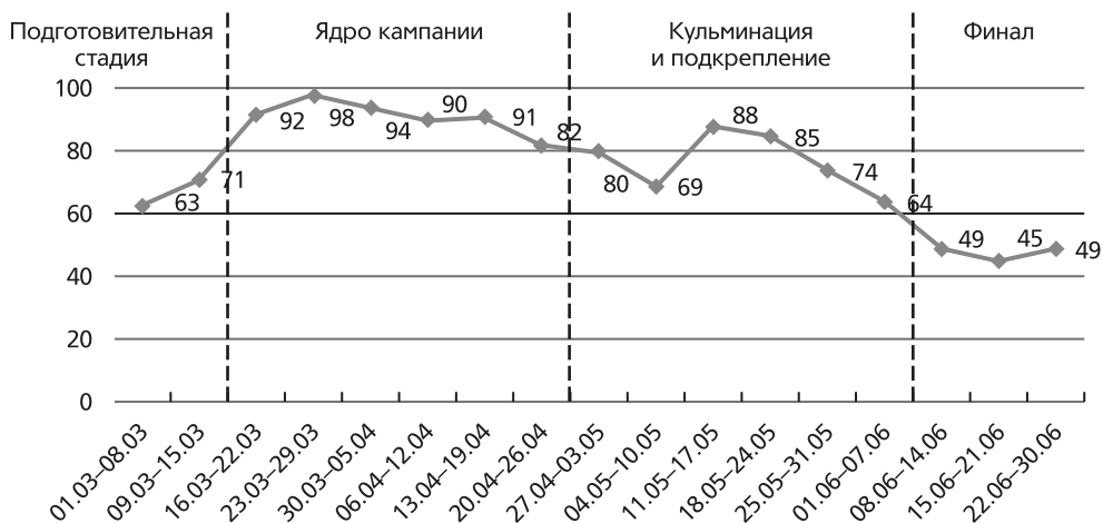
Рис. 1. Доля медиасюжетов, включавших информацию о коронавирусе, среди всех сообщений в новостных программах в каждый временной отрезок (%)

Место сюжетов о пандемии COVID-19 в общей новостной повестке Первого канала. Всего в анализ был включен 2161 медиасюжет из 122 новостных программ, из них прямых сообщений о COVID-19 – 1694. Для количественной оценки использовалась характеристика «плотности медиасюжетов», определяемая как доля сообщений с определенным содержанием среди всех сюжетов новостной программы. На протяжении 120 дней в каждую новостную программу входило более 10 сюжетов, связанных с COVID-19. Большинство из них напрямую посвящено COVID-19 (78%), некоторая часть включала информацию о пандемии в рамках других информационных сообщений (22%). На рис. 1 ежедневные медиасюжеты сгруппированы в недельные интервалы, чтобы сгладить случайные колебания и выделить общую тенденцию.