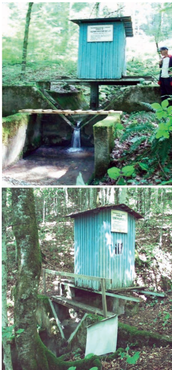
Рис. 2. Гидрометрические посты на 2-ом и 4-ом ручьях ЛГС “Аибга” для учета ручьевого стока с помощью самописцев (оригинальная конструкция водосливов разработана авторами).

ЛГС “Аибга”, после сплошнолесосечной и 3-х приемов группово-постепенных котловинных рубок рекомендуется своевременное прореживание с уборкой сопутствующих пород, мешающих росту главной породы, отставших в росте и пораженных болезнями деревьев бука и других ценных пород. (Коваль и др., 2012). Полученные по результатам многолетних исследований зависимости показали устойчивую тенденцию к стабилизации экологи-