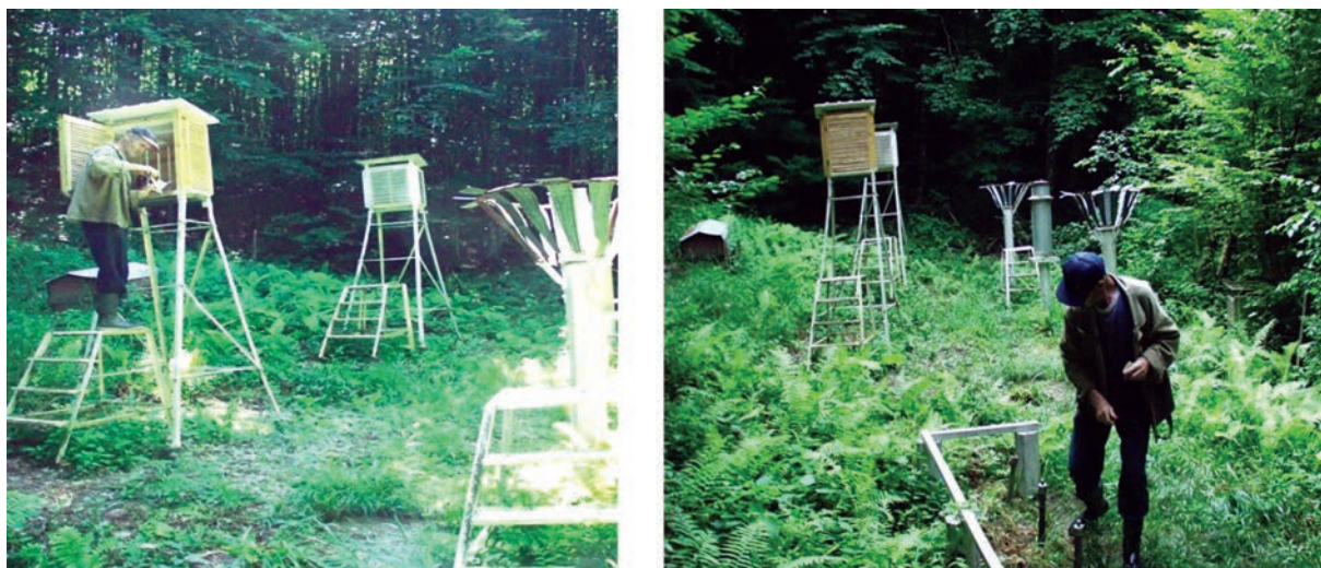
Рис. 3. Метеорологические наблюдения на метеоплощадках в лесу – ЛГС “Аибга”.