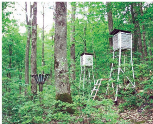
Рис. 5. Наблюдения за микроклиматом на метеоплощадках ЛГС “Горский”.