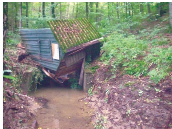
Рис. 6. Слева – водослив на гидрометрическом посту 3-го ручья ЛГС “Горский”. Справа – повреждения поста после катастрофического паводка в 2001 г.

нередко наблюдались катастрофические паводки, наносящие значительный урон сооружениям ЛГС. Так, во время выпадения на ручьях ЛГС “Горский” в июне 2001 г. смерчевых осадков произошли разрушения гидрометрических сооружений на водосборах № 2 и № 3. После интенсивных осадков, превышающих 225 мм за 2 ч, образовались паводки исключительно редкой повторяемости. Так, на водосборе № 3 расчеты максимального паводка по меткам высоких вод дали величины скорости потока 10.3 и 9.08 м/с, что соответствует расчетному расходу по одному варианту Q = 28.0 \text{ м}^3/\text{с} , а по другому варианту – 24.7 \text{ м}^3/\text{с} , т.е. максимальный паводок на ручьях ЛГС “Горский” 30 июня 2001 г. достигал 25–28 \text{м}^3/\text{с} (рис. 6б).