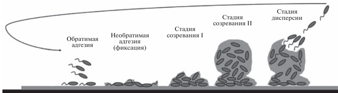
Рис. 2. Стадии формирования биопленки (по Palanisamy et al., 2014).

трического слоя (De Weger et al., 1987). Впоследствии придатки клеток вступают в контакт с объемом кондиционируемого поверхностью слоя, стимулируя химические реакции, такие как окисление и гидратация (Ganesh, Anand, 1998), и упрочняют связь бактерий с поверхностью. Некоторые данные показывают, что микробная адгезия сильно зависит от гидрофобно-гидрофильных свойств взаимодействующих поверхностей (Liu et al., 2004).